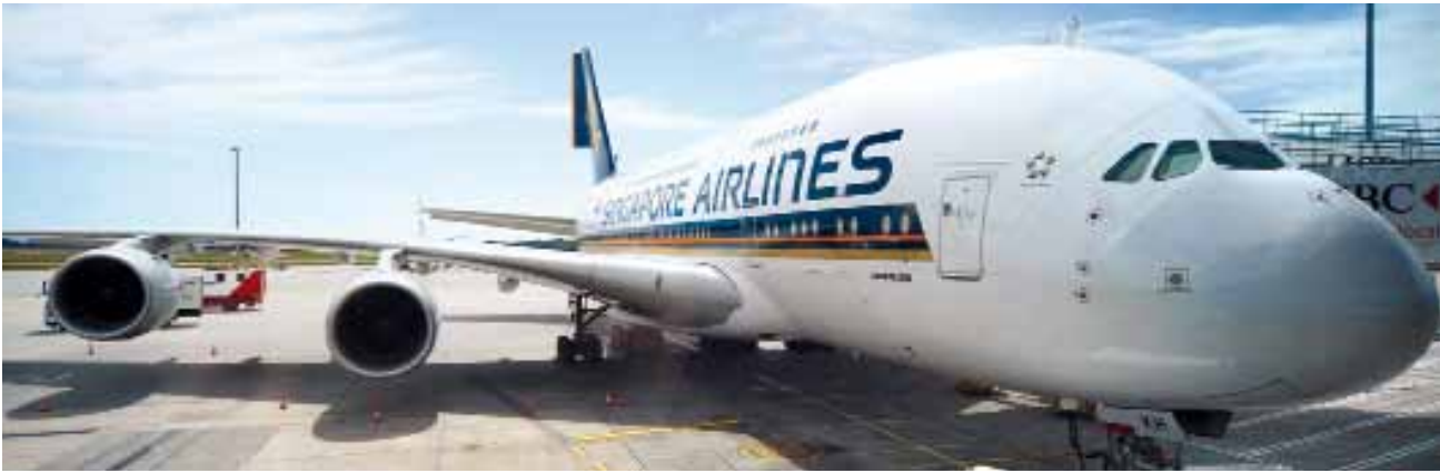
Der Airbus A380 hat sich bereits als Nachfolger der Boeing 747 etabliert. Wichtigste Rolle im laufenden Asset-Management spielt die Dokumentation der unzähligen Bauteile. Beim Verkauf oder der Übergabe an einen neuen Leasingnehmer sorgt die nachgewiesene lückenlose Kontrolle für bessere Preise.

Diesmal umfasste die Auslagerung auf Externe bei Lloyd Fonds aber nicht nur den technisch-operativen Bereich. East Merchant hat auch die Verhandlungen im Sale-and-Lease-Back-Verfahren geführt. Die Leipziger hatten wie Hannover Leasing, Dr. Peters und Doric Asset Finance am Ausschreibungsverfahren von Singapore Airlines teilgenommen.