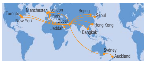
Flugrouten der Emirates A380-Flotte

Das Flugzeug der Beteiligungsgesellschaft ist in den Vereinigten Arabischen Emiraten unter dem Kennzeichen A6-EDH registriert. Emirates setzt den Airbus A380 vornehmlich auf Strecken von Dubai nach Europa sowie zu Flügen nach Asien ein. Im Juni 2011 hat das Flugzeug bereits seinen eintausendsten Flug absolvieren können. Insgesamt war der Airbus A380 seit seiner Auslieferung knapp 6.500 Stunden in der Luft. Die durchschnittliche Fluglänge lag damit bisher bei ungefähr sechseinhalb Stunden pro Flug. Dies ist für ein Langstreckenflugzeug wie den Airbus A380 ein vergleichsweise geringer Wert. Bei der im Mai 2011 durchgeführten ersten Inspektion des Flugzeuges und der dazugehörigen technischen Unterlagen wurde der einwandfreie Zustand des Flugzeuges festgestellt. Leasingraten sowie Zins und Tilgung des Darlehens sind langfristig fixiert. Entsprechend wird von einem planmäßigen Verlauf der Beteiligung ausgegangen.