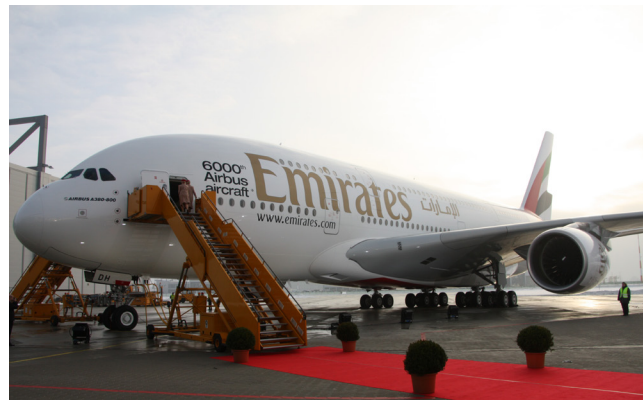
Übergabe des 6000. Flugzeuges von Airbus, des SKY CLOUD-A380, am 18. Januar 2010 in Hamburg

Die weiteren Erfolgsfaktoren für Emirates sind eine klare Geschäftsausrichtung auf Mittel- und Langstrecken mit einer One-stop-Strategie in Dubai, ein aktives Strecken- und Personalmanagement sowie die Fokussierung auf eine treibstoffeffiziente Flugzeugflotte.